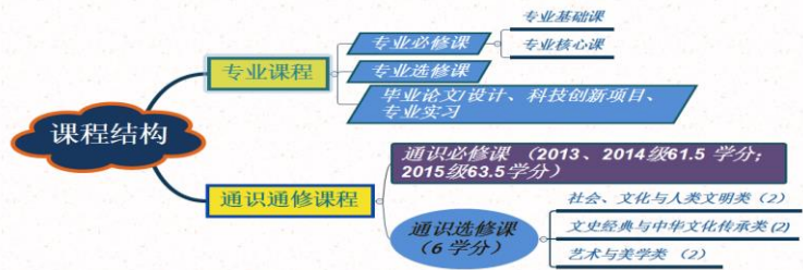
2016级培养方案课程结构图